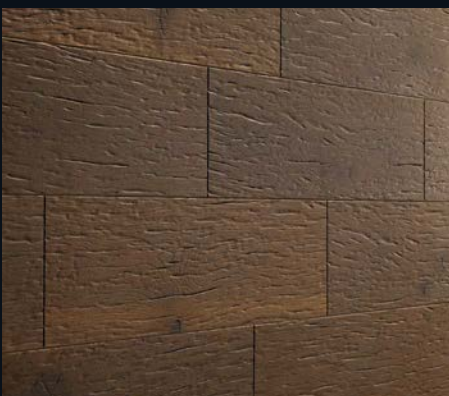
Steam Oak 4305 Industrial-Wood-Struktur, gebürstet | naturgeölt