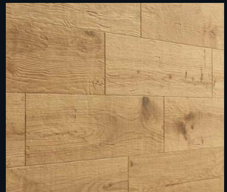
Natural Oak 4301 Vintage-Struktur, gebürstet | naturgeölt