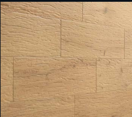
Pure Oak 4303 Industrial-Wood-Struktur, gebürstet | naturgeölt