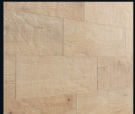
Cream Oak 4302 Vintage-Struktur, gebürstet | naturgeölt