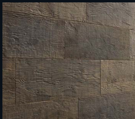
Old Denim Oak 4304 Vintage-Struktur, gebürstet | naturgeölt