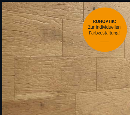
Raw Oak R34 Industrial-Wood-Struktur, gebürstet