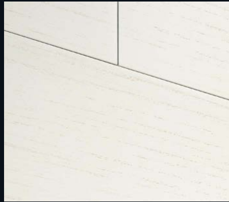
Delgado Esche 167 | Holznachbildung