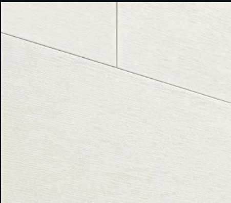
Ridge Oak grey 4201 | Holznachbildung