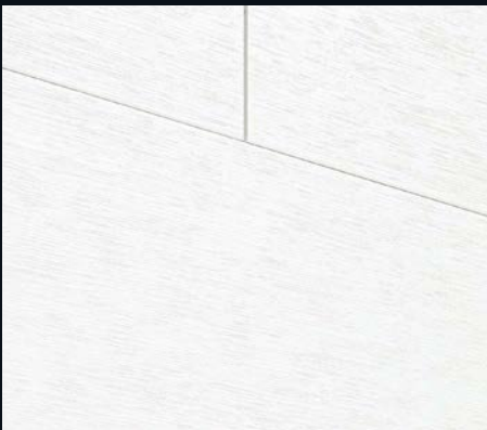
Ridge Oak white 4200 | Holznachbildung