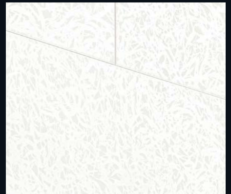
Duo Gloss White 4089 | Dekor