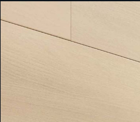
Akazie hell 4012 | Holznachbildung