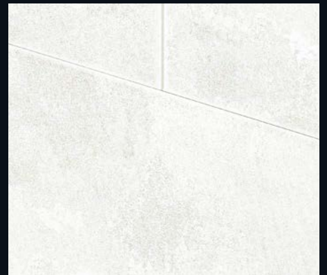
White Cloud 4202 | Dekor