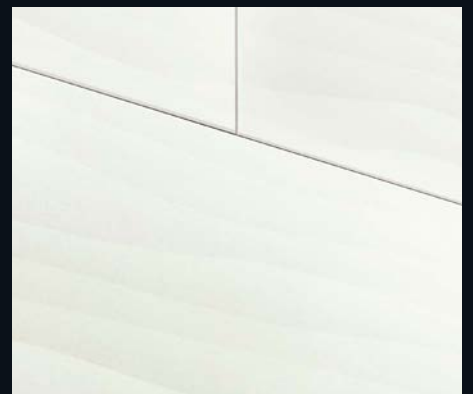
White Vision 4203 | Dekor