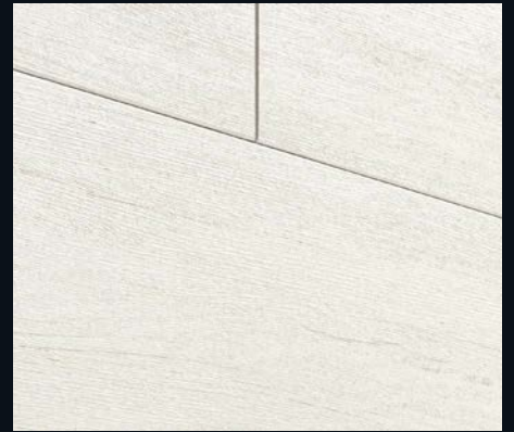
White Pine 4088 | Holznachbildung