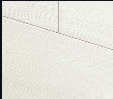
Mountain Wood grey 4204 | Holznachbildung