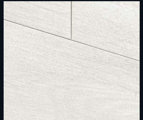
Corona 4087 | Dekor