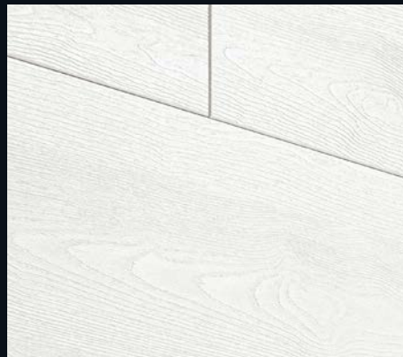
Mountain Wood white 4205 | Holznachbildung