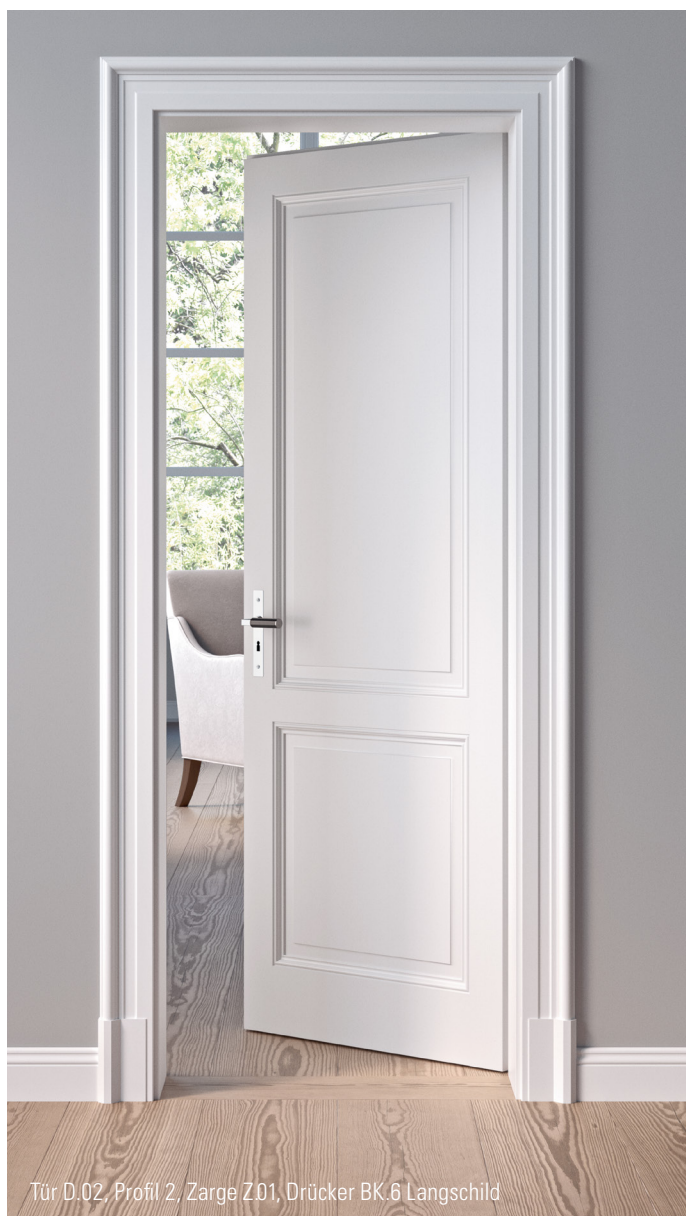
Tür D.02, Profil 2, Zarge Z01, Drücker BK.6 Langschild