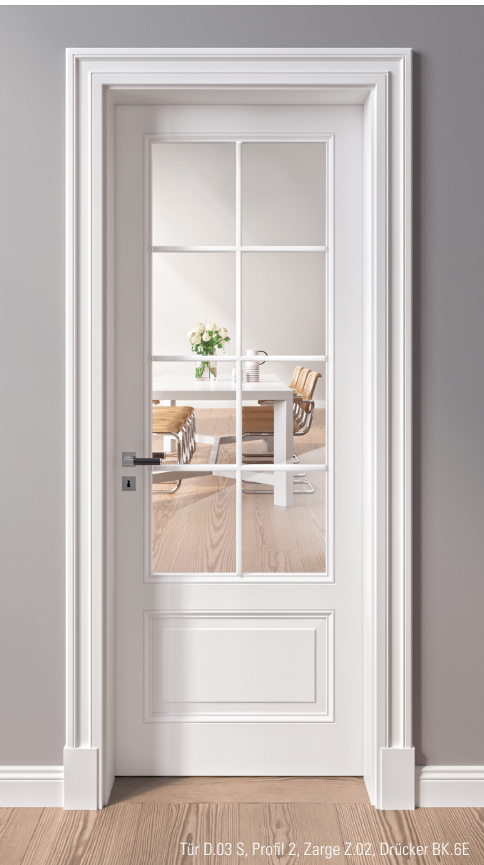
Tür D.03 S, Profil 2, Zarge Z.02, Drücker BK.6E

Mit Liebe zum Detail – Profile- rungen, stilvoll variiert – eine Reminiszenz an die Historie.