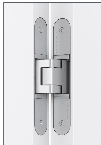
Beispiel: verdecktes Band – matt

Details für das Gesamtbild: Legen Sie Wert auf »SCHÖNES DAZU«