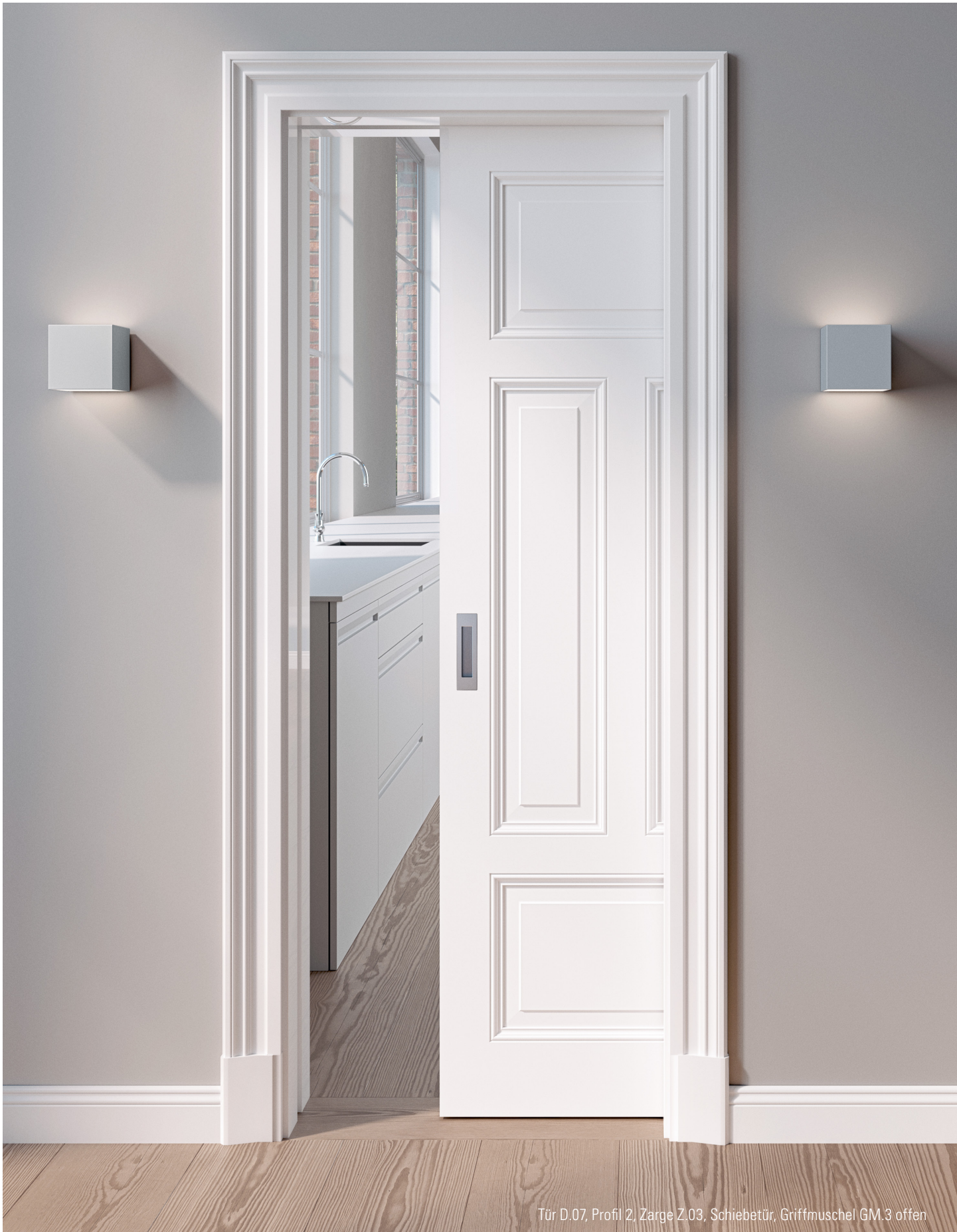
Tür D.07, Profil 2, Zarge Z.03, Schiebetür, Griffmuschel GM.3 offen