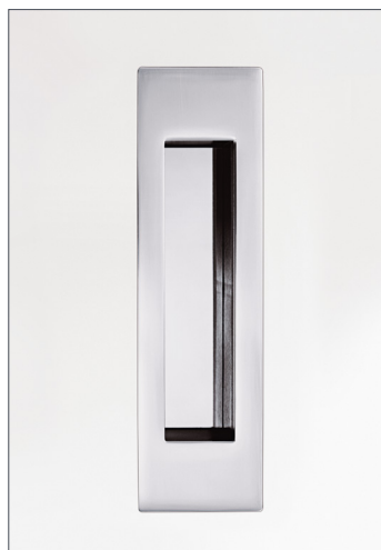
Beispiel: GM.3 offen, flächenbündig