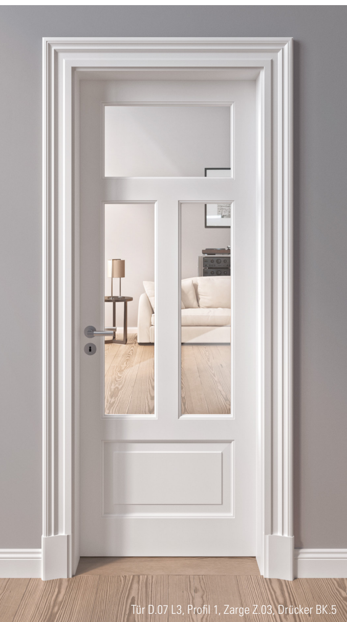
Tür D.07 L3, Profil 1, Zarge Z.03, Drücker BK.5

Authentische Anlehnung an historische Vorbilder bedeuten heute Luxus und Wohlbefinden.