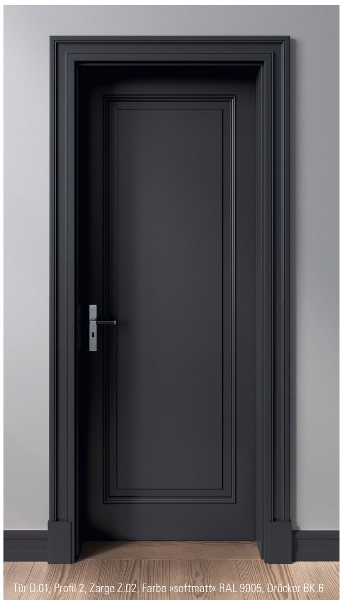
Tür D.01, Profil 2, Zarge Z.02, Farbe »softmatt« RAL 9005, Drücker BK.6