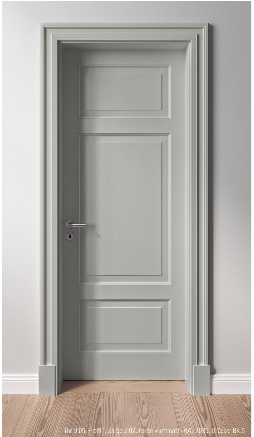
Tür D.05, Profil 1, Zarge Z.02, Farbe »softmatt« RAL 7035, Drücker BK.5

Dort wo es nötig ist und dort wo es möglich ist, sollte alte Bausubstanz erhalten werden – nicht nur im Denkmalschutz. Viele schöne Häuser warten auf schöne Türen. Die Anforderung von heute: Ein Raum darf vergangene Opulenz ausstrahlen, aber mit neuer Technik den baulichen Standard der Gegenwart erfüllen.