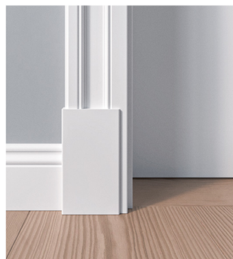
Sockel für Zarge Z.02