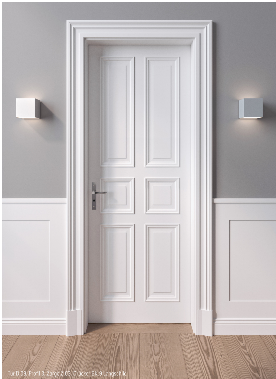
Tür D.09, Profil 3, Zarge Z.03, Drücker BK.9 Langschild

Die Türen als erstes Gestaltungsmittel bestimmen den Charakter eines Raumes. Die Aufteilung der Fläche mit der Anzahl der Felder gibt der Tür den Ausdruck und bestimmt die Persönlichkeit. Eine Übersicht aller Modelle zeigen wir auf den letzten Seiten.