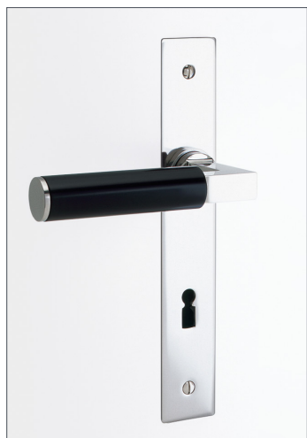
Beispiel: BK.6, Langschild, flächenbündig

D.01 S D.02 S D.03 S D.04 S D.05 S D.06 S D.07 S D.08 S D.09 S