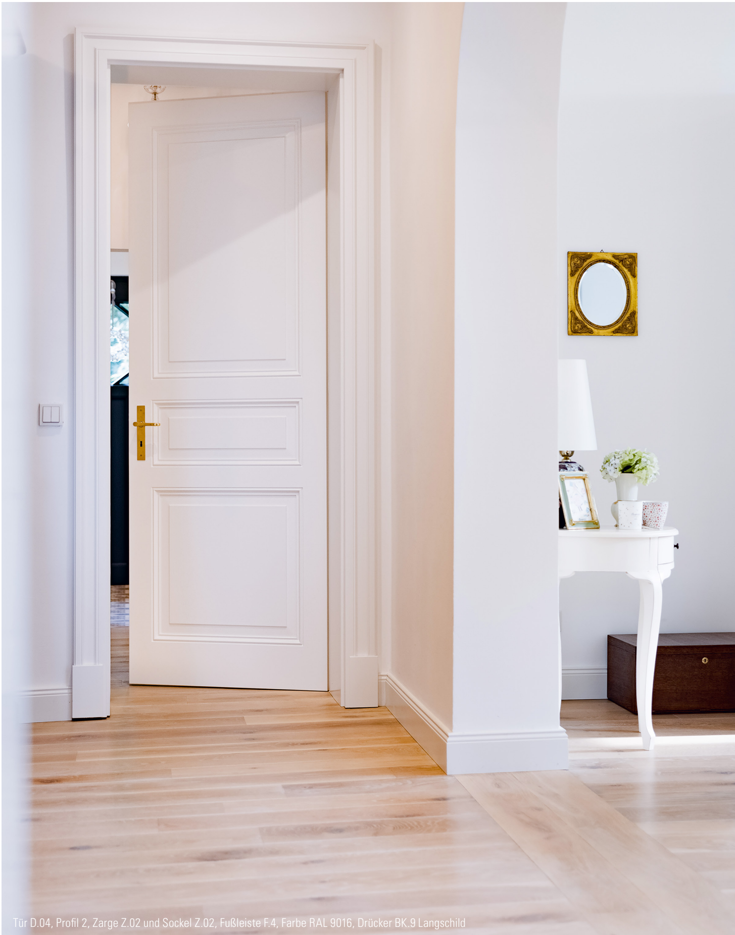
Tür D.04, Profil 2, Zarge Z.02 und Sockel Z.02, Fußleiste F.4, Farbe RAL 9016, Drücker BK.9 Langschild

Denkmalschutz- und Villentüren fertigen wir gern in Höhen, die für repräsentative Räume erforderlich sind.