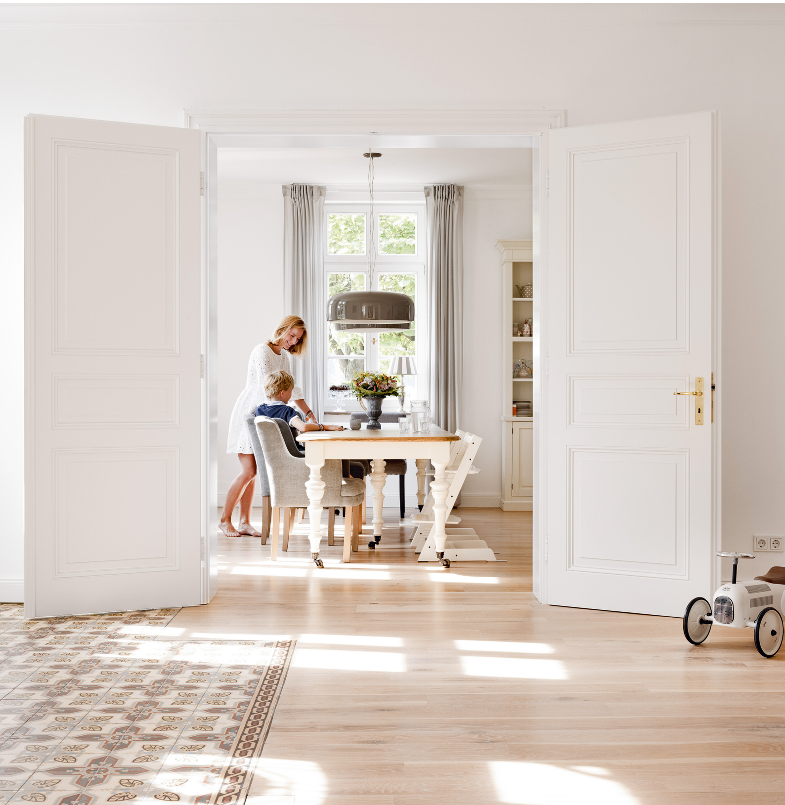
RESTAURIERTER VIERKANTHOF | Tür D.04, Profil 2, Zarge Z.02 und Sockel Z.02, Türhöhe bis 2,485 m