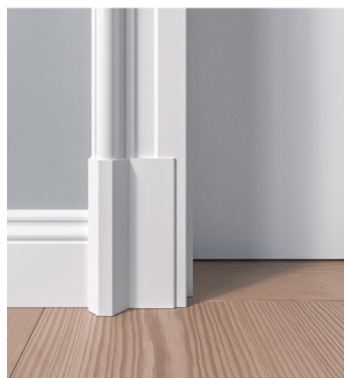
Sockel für Zarge Z.01

Dazugehörig, als optischer Schlusspunkt, die Sockelstücke, die an keiner handwerklich gearbeiteten Tür fehlen dürfen.