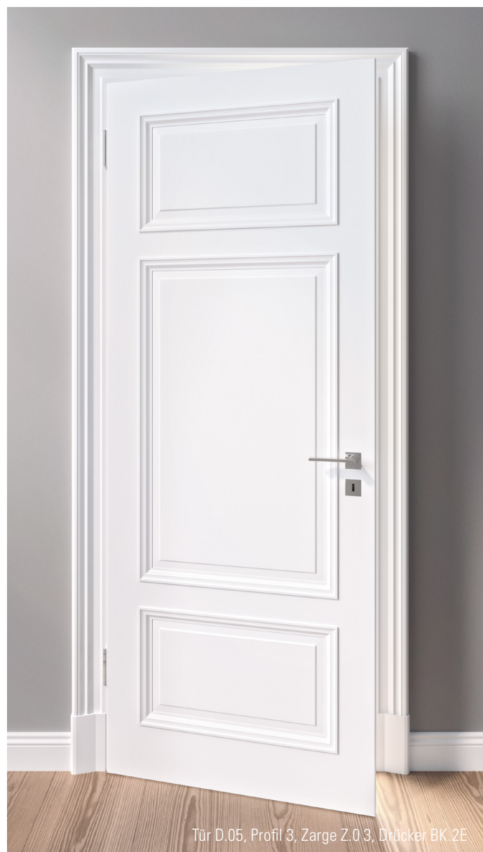
Tür D.05, Profil 3, Zarge Z.03, Drücker BK.2E