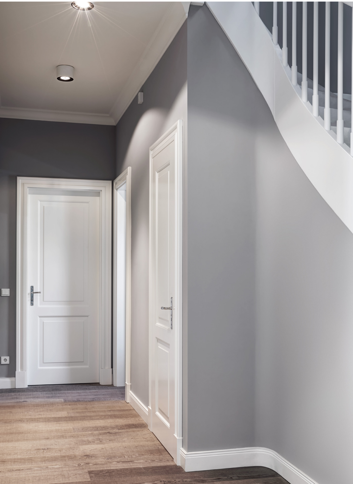
PRIVATHAUS BERLIN | Tür D.02, Profil 1, Zarge Z.02, stumpf, verdeckte Bänder