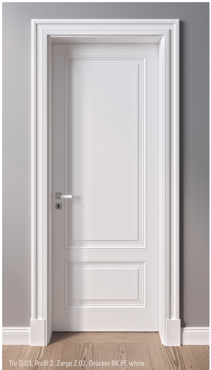
Tür D.03, Profil 2, Zarge Z.02, Drücker BK.6E white